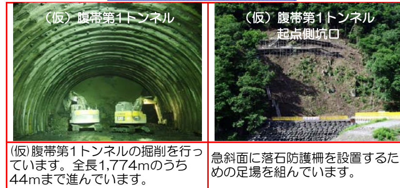
①施工：戸田・岩田地崎JV

(仮)腹帯第1トンネルの掘削を行っています。全長1,774mのうち44mまで進んでいます。