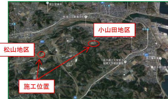
【松山地区、小山田地区 位置図】

平成28年8月3日からのスタートであった「小山田松山地区道路改良工事」が、平成29年8月10日をもって工事が完了いたしました。本工事は、小山田地区においてはP1橋脚1基と道路掘削及び土砂搬出（11,920m 3 ）、松山地区においては道路掘削及び土砂搬出（36,010m 3 ）の工事を携わりました。思い出といたしましては、本工事を施工する前に台風10号（平成28年8月30日）の影響により閉伊川の氾濫により甚大なる災害が発生し、当現場としては墓目地区の流木の撤去を含め他の施工会社さんと国道106号の啓開作業に携わったことを思い出されます。最後に当現場も関係各位様のおかげを持ちまして無事故・無災害で完了したことをお礼申し上げます。