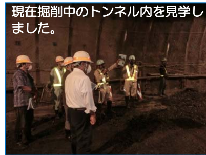
現在掘削中のトンネル内を見学しました。