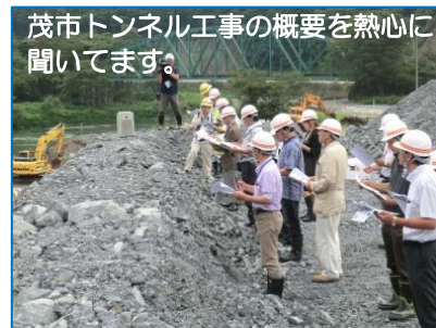
茂市トンネル工事の概要を熱心に聞いています。