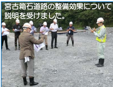
宮古箱石道路の整備効果について説明を受けました。

平成29年8月22日（火）、宮古商工会議所（15名）による「宮古箱石道路」の現場見学会が行われました。現場は茂市トンネル工事と茂市地区道路工事で、宮古箱石道路の整備効果と茂市トンネル工事の概要について説明を受け見学しました。見学者からは「トンネルの掘削は一日どのくらいですか？」との質問があり「3～4m/日です。」と回答しました。茂市地区道路工事では掘削中のトンネルに入り、工事の進捗について説明を受けました。直接現場に触れることにより、より工事の進捗状況が実感出来たことと思います。