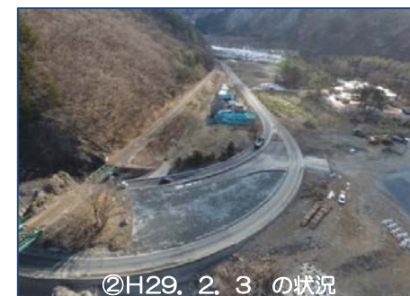
②H29. 2. 3 の状況