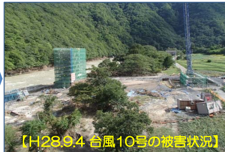
【H28.9.4 台風10号の被害状況】