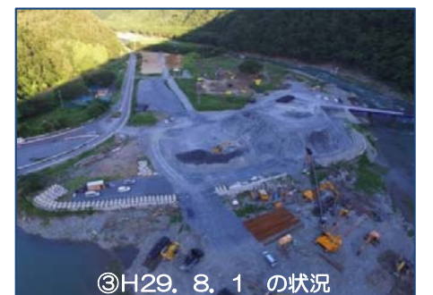
③H29. 8. 1 の状況