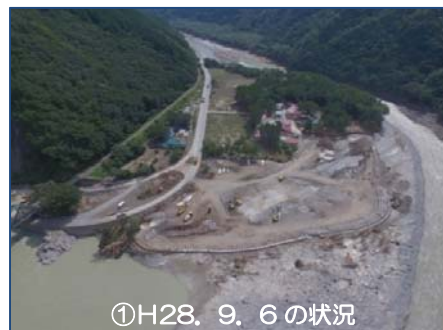
①H28. 9. 6 の状況